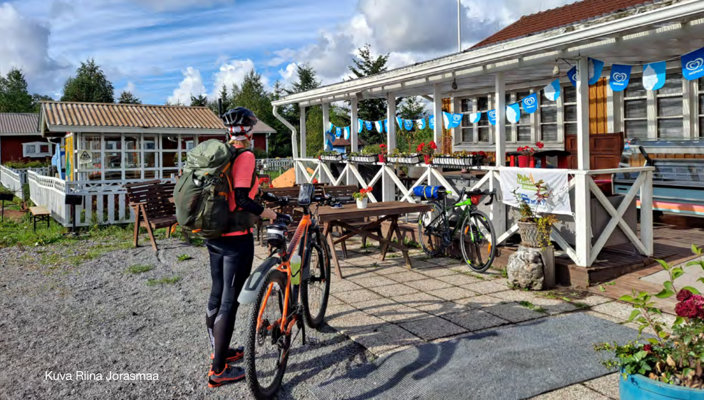
Kuva Riina Jorasmaa